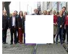
Programm für die Quadriennale 2014 in Düsseldorf