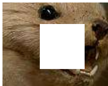
Wildtiere in Düsseldorf