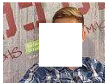
95 Olé! Das Stadtwerke Düsseldorf Fan-Magazin. Zu Gast: Hein..