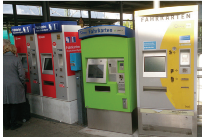
So sieht die Alternative aus...