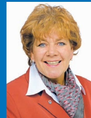
BEATE WILDING Oberbürgermeisterin der Stadt Remscheid